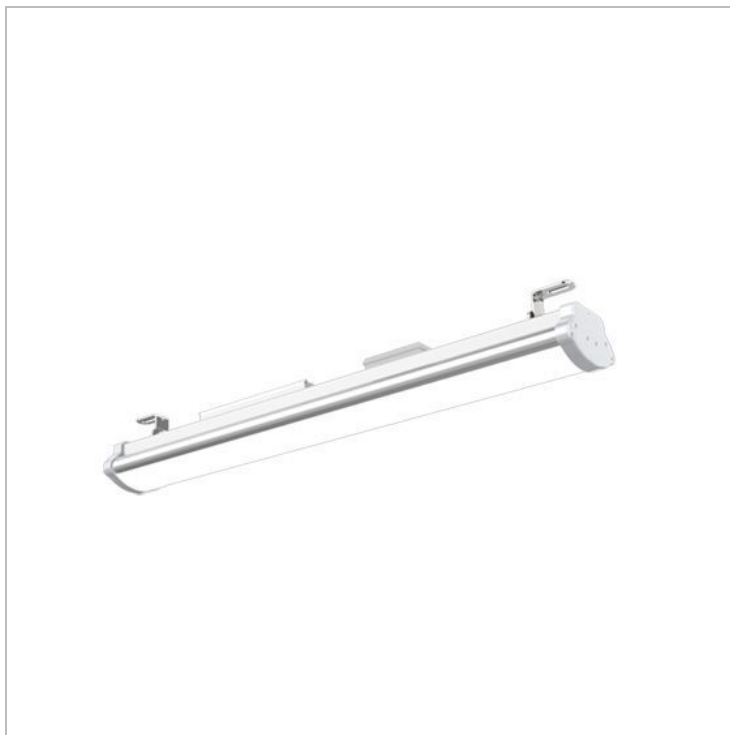
Réf : UBOAT2004HODA