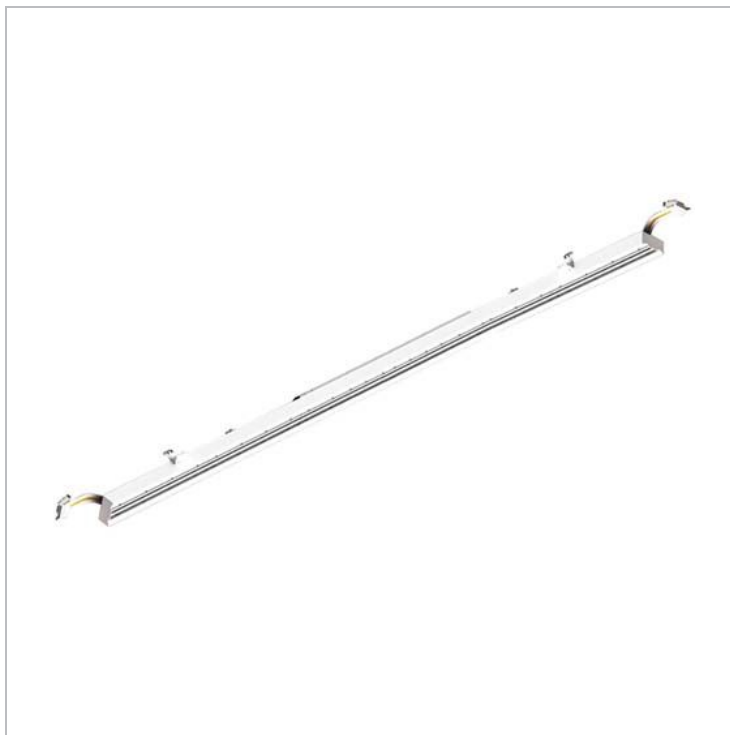
Réf : DMAUNI15755R60